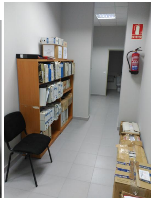
Documentación tras la rehabilitación del espacio como archivo y recolocación provisional, 2019