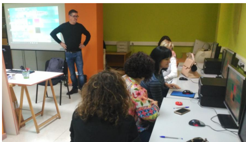
Curso de gestión documental y archivo para personal contratado de León y Ponferrada en León, 22 y 23 de mayo de 2019