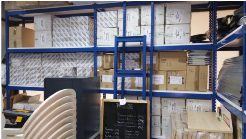
El espacio del archivo usado como almacén, año 2017